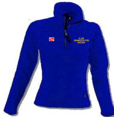
Pile crew (art.0729) (Inverno– colore: BLU / PANNA)