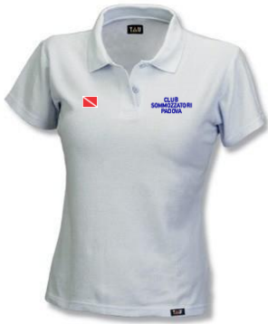
Polo piquet crew m.c. (art. 8051) (Estate – colore: NAVY / BIANCO)