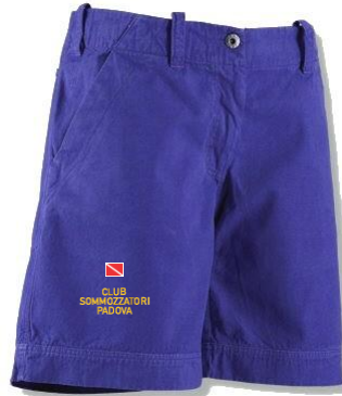
Short canvas crew (art. 0033) (Estate – colore: BLU / DESERTO)