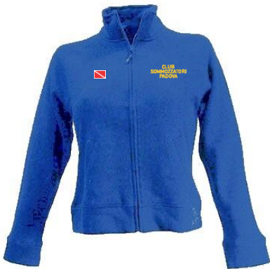
Felpa (art. 8091) (Estate – colore: BLU)