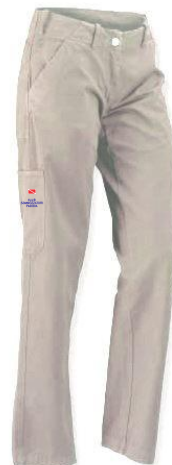
Pantaloni canvas (art.0034) (Inverno– colore: DESERTO)