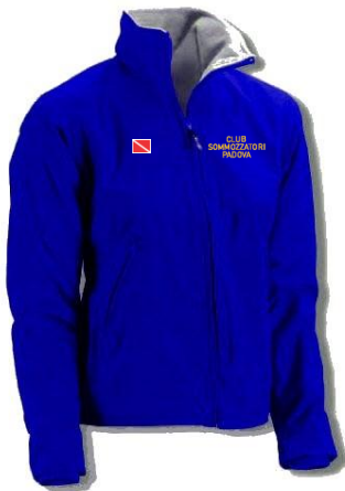
Sailor foderato pile (art. 0080) (Inverno – colore: BLU)